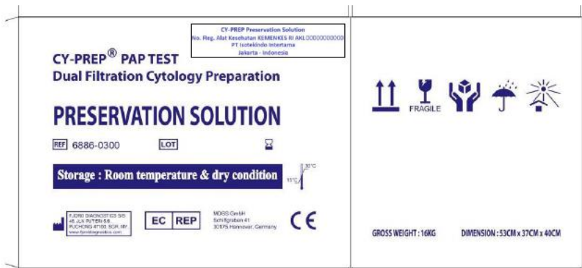
Depan & Belakang