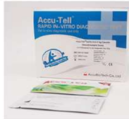
GAMBAR KEMASAN SEKUNDER