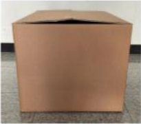
Left Side View