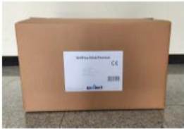
Back Side View