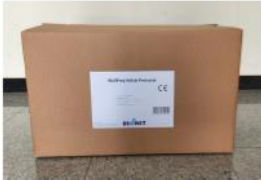
Front Side View