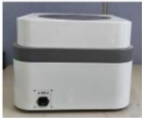
Back Side View