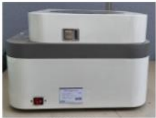
Right Side View