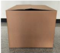
Right Side View