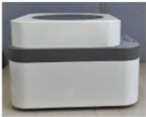
Left Side View