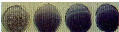
Strong Weak Negative