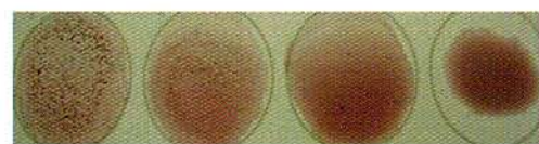
Strong Weak Negative